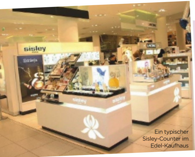
Ein typischer Sisley-Counter im Edel-Kaufhaus

Sie suchen ein neues Pflegeprodukt? Mit diesen drei Beratungsmodellen läuft Ihr KOSMETIKKAUF garantiert glatt