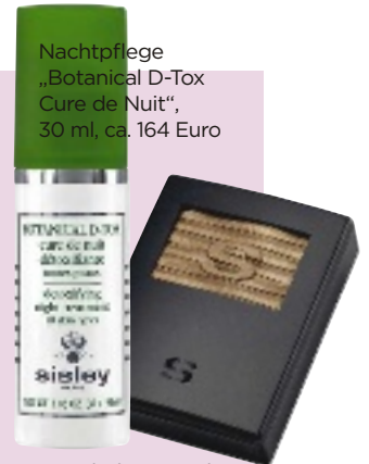
Nachtpflege „Botanical D-Tox Cure de Nuit“, 30 ml, ca. 164 Euro

Wenn es um Neuheiten in Sachen Pflege, Make-up oder Parfum geht, sind die Damen am Sisley-Tresen die richtige Wahl. Wer mag, erlebt seine künftige Lieblingscreme während der 15-minütigen Pflegebehandlung Beauty Express Protocol hautnah und erhält dabei spezifische Anwendungstipps für das ganz persönliche Hautbedürfnis . Make-up-Tricks runden das Angebot ab. Außerdem nur an Sisley-Verkaufscoutern: Goodies wie Einladungen zu Produktpremierern, Kundengeschenke und Testmuster.