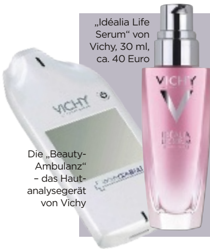
Die „Beauty-Ambulanz“ – das Hautanalysegerät von Vichy