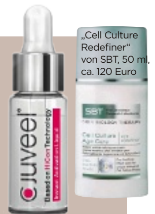
„Juveel“ von MedSkin Solutions, ca. 120 Euro

Das Tolle am KosmetikkauF im Day-Spa: Die Produkte in den Regalen werden in der Kabine angewendet. Man profitiert also vom Erfahrungsschatz der Beauty-Profis, die entsprechend differenziert beraten können. Eine Behandlung ist außerdem die perfekte Gelegenheit, zu testen, ob individuelle Hautbedürfnisse und Wirksamkeit der neuen Pflegeserie zusammenpassen. Gut zu wissen: Viele hocheffektive Spezialprodukte, die im dermatologischen Day-Spa zum Einsatz kommen, gibt es nur hier zu kaufen.