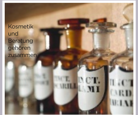
Kosmetik und Beratung gehören zusammen